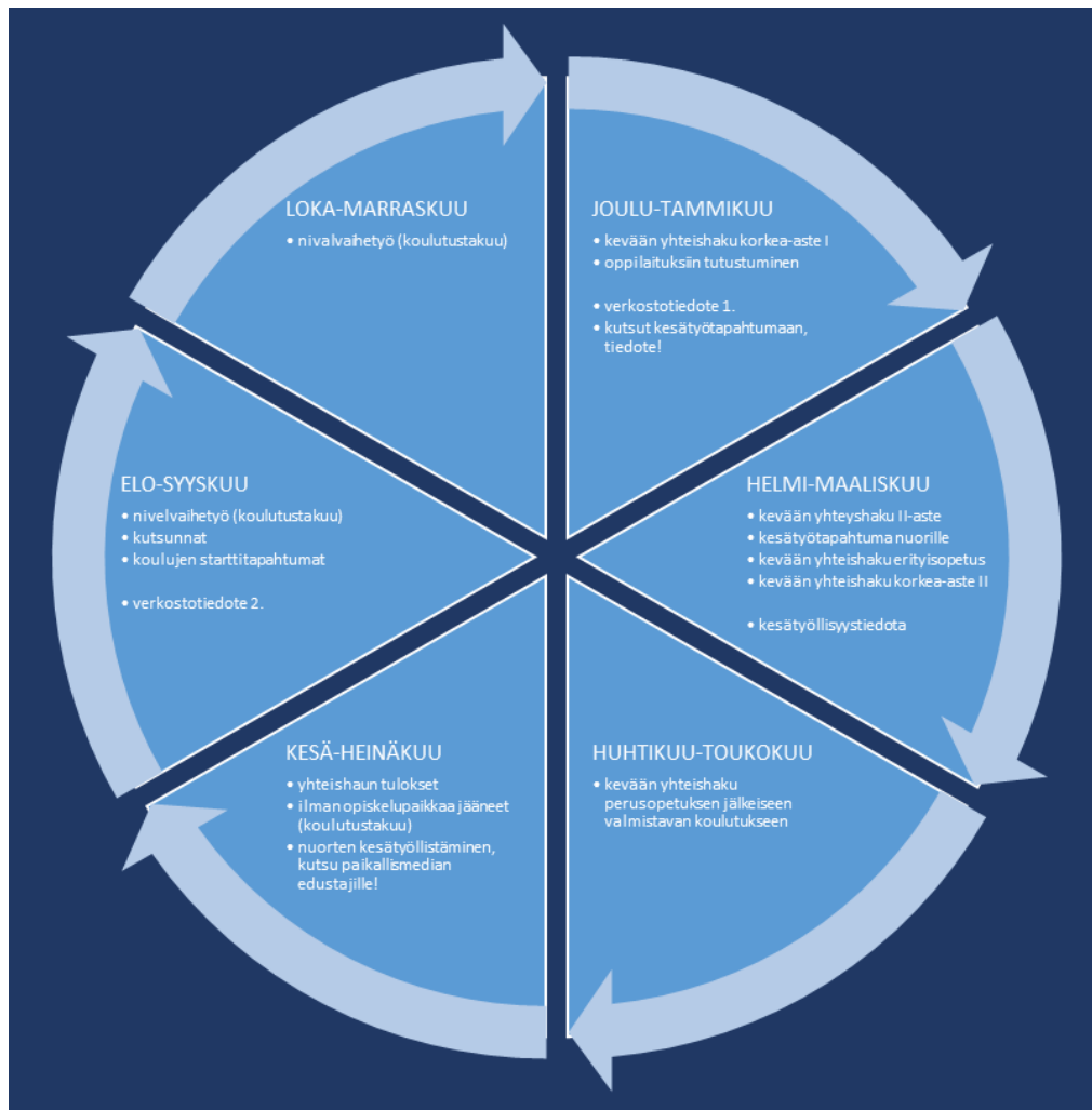
Kuva 1. Kuvitteellinen esimerkki etsivän nuorisotyön toiminta- ja viestintäsuunnitelman vuosikellosta