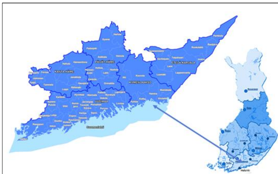
Kuvio 2 Etelä-Suomen aluehallintoviraston toimialue