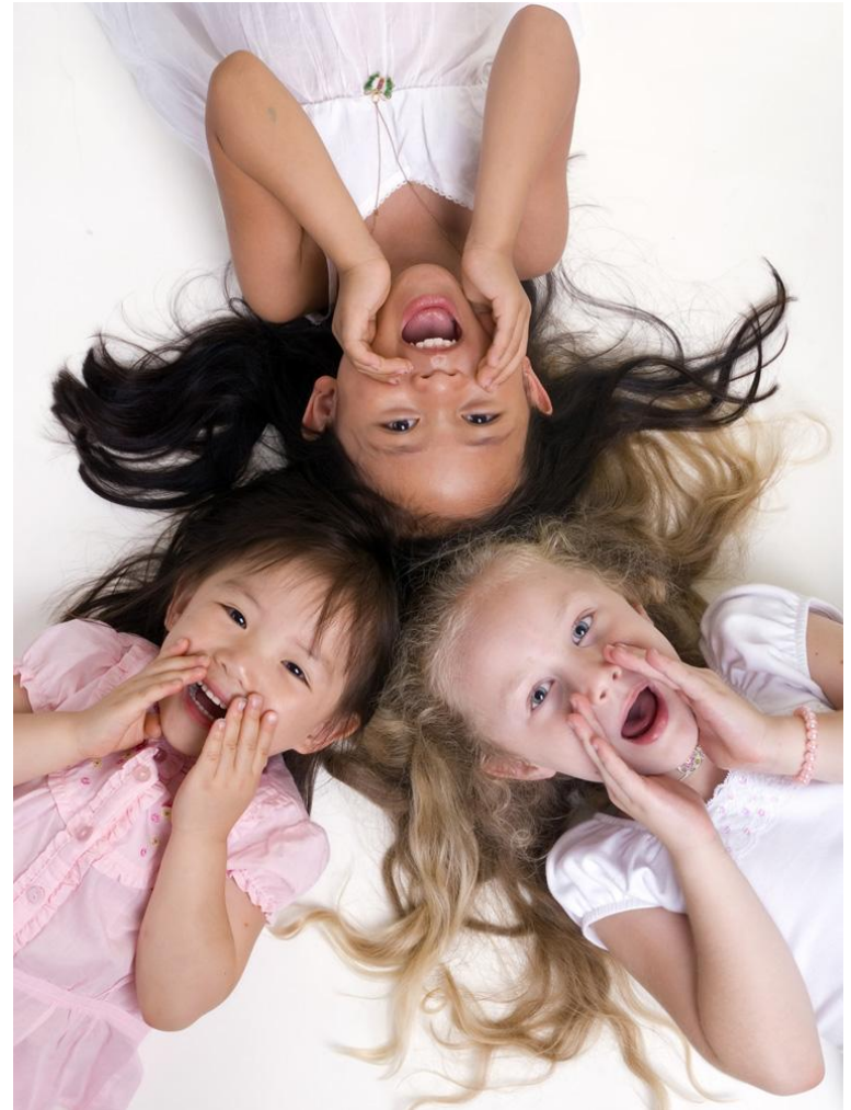
TERVEYDEN JA HYVINVOINNIN LAITOS