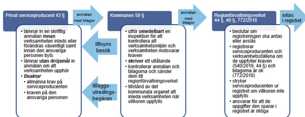
Figur 3. Den privata serviceproducentens, kommunens och regionförvaltningsverkets uppgifter vid anmälningsförfarandet

Till anmälan fogas de utredningar och handlingar som efterfrågas i anmälningsblanketten. Behandlingen av ärendet går snabbare om anmälan är noggrant och komplett ifylld. Blanketter för anmälan finns på www.rfv.fi och www.suomi.fi .