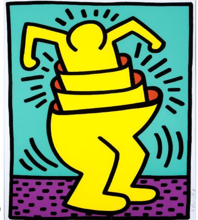
konstnär: Keith Haring

(ifrågasätter matchningsteorin – Hollands karriärteori)